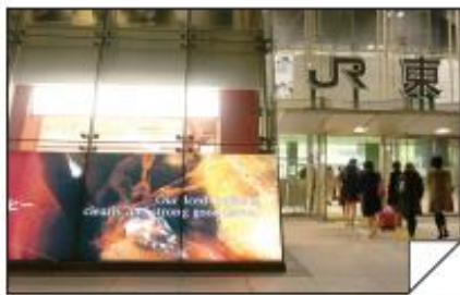
東京駅東日本橋出口