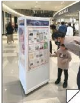
柏市 セブンアリオ柏