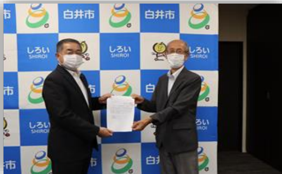
(笠井市長・野水代表理事)