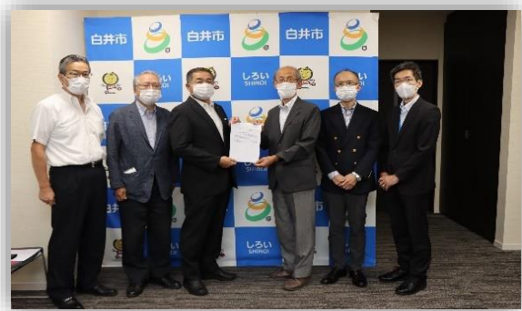
(染谷・駒村・笠井・野水・尾籠・藤本) 敬称略

上記のほか、9月8日(水)に白井市役所・道路課に道路補修・安全対策・清掃等の個別要望書を提出しました。