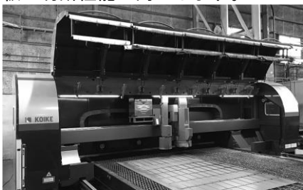
ガス・溶接・切断のトータルシステムサプライヤー

ビームモード可変テクノロジーで厚板切断の品質向上と難切断材への安定切断を可能とします。更に錆板の切断性能が向上します。