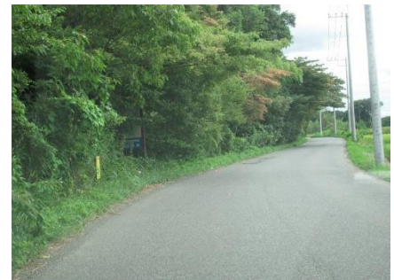
(未整備のアクセス道路)