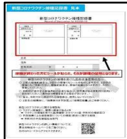
(ワクチン接種記録書)