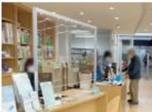
成田市立図書館別館様