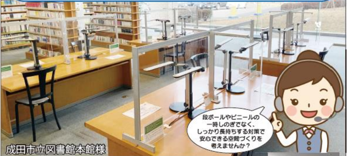
成田市立図書館本館様

段ボールやビニールの一時しのぎでなく、しっかり長持ちする対策で安心できる空間づくりを考へませんか？