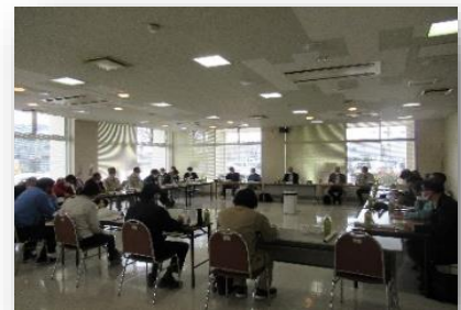
( 会議の様子 )