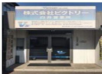
（白井機材センター）

建設資材輸送の事なら、建設資材輸送専門のVs-groupへお問い合わせください。