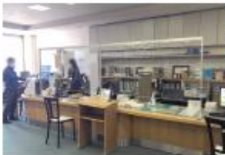
成田市立図書館本館様

段ボールやビニールの一時しのぎでなく、しっかり長持ちする対策で安心できる空間づくりを考へませんか？