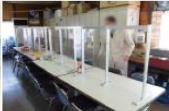
白井市工業団地リックス様