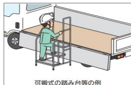
可搬式の踏み台等の例

貨物自動車に設置されているステップで突出していないもの(上から見たときにステップが見えない棟)は、墜落・転落するリスクが高いため、より安全な昇降設備を設置するようにしてください。